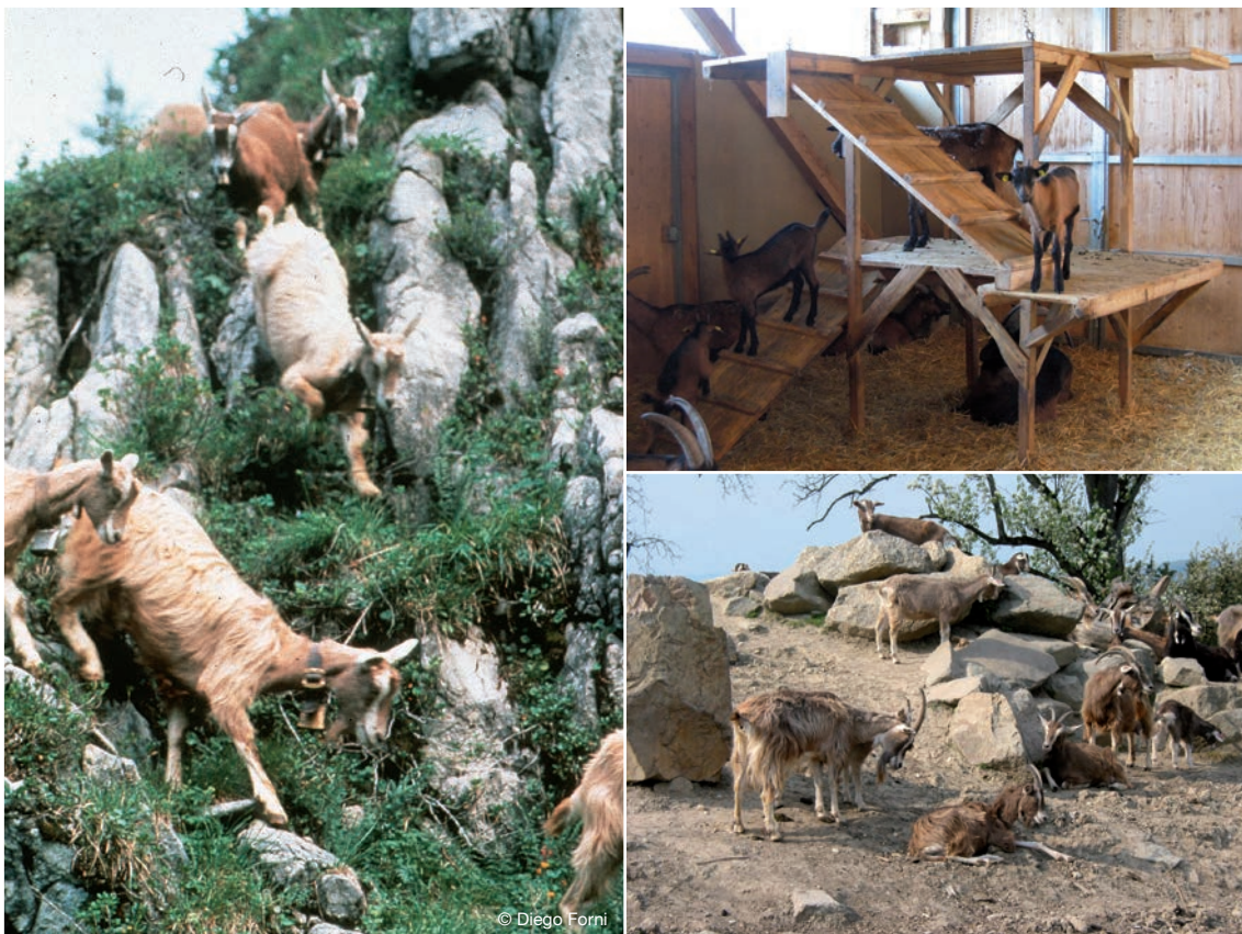
Abbildung 2: Ziegen stammen aus Hochgebirgsgegenden, in denen sie viel klettern müssen (links Milchziegen auf der Alp). Klettermöglichkeiten bei der Haltung fördern daher das Wohlbefinden der Ziegen (Mitte: Kletterturm im Stall; rechts: Auslauf mit Felsen zum Klettern).

Um Ziegen im Laufstall erfolgreich halten zu können und Stress und Verletzungen zu minimieren, muss ihr natürliches Sozialverhalten, die dahinter stehende Motivation und deren Auswirkungen verstanden werden. Dieses Wissen muss dann bei der Planung und Ausgestaltung des Laufstalles und beim Herdenmanagement umgesetzt werden, um den Bedürfnissen der Tiere Rechnung zu tragen.