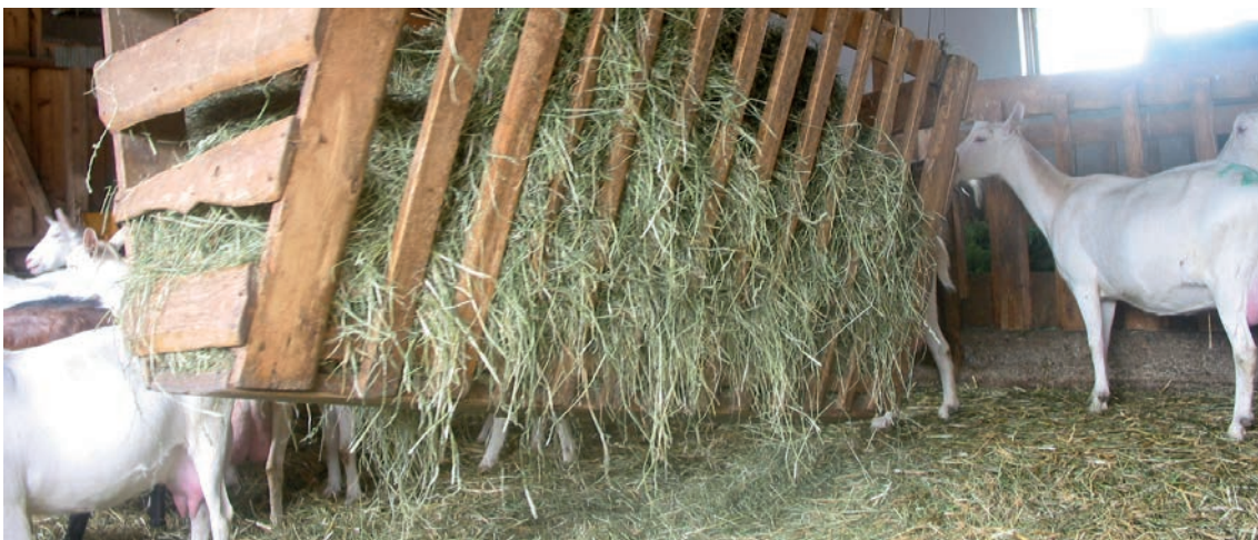
Abbildung 14: Heuraufen zusätzlich zum Fressgitter bieten Sichtschutz und Vermindern die Konkurrenz