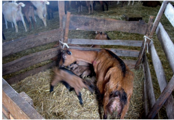
Abbildung 18: Mutter-Kitz-Bucht in der Herde erleichtert die Wiedereingliederung

Zucht auf sozial verträgliche Tiere: Einzelne Tiere, die immer wieder aggressives Verhalten zeigen, können das Verhalten