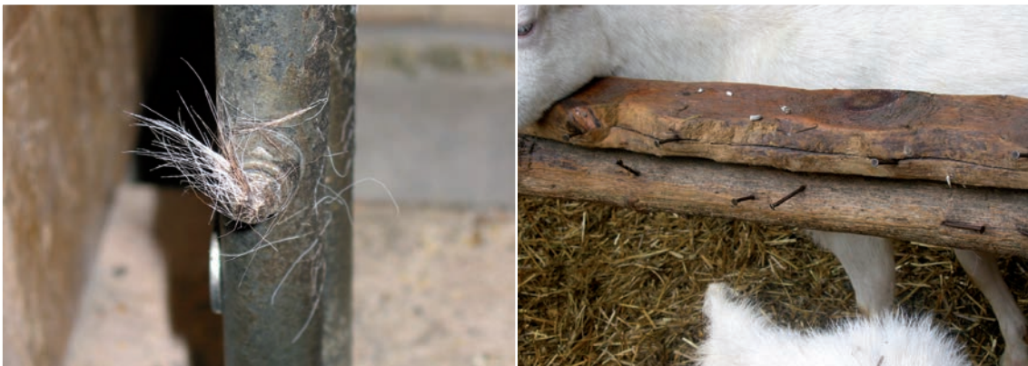
Abbildung 57: Vorstehende Nägel, Schrauben, gebrochene Einrichtungen etc. führen zu Verletzungen.