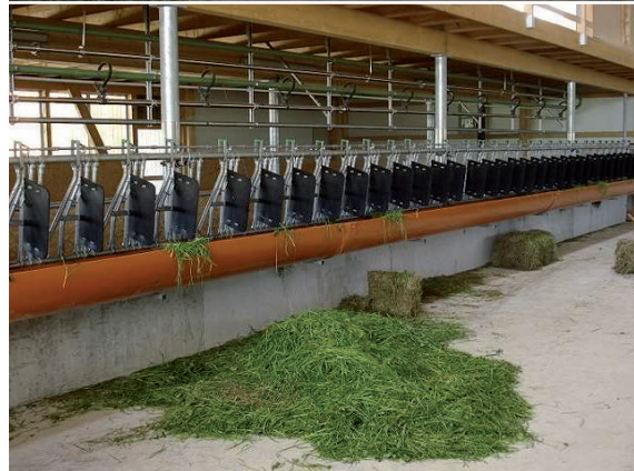
Abbildung 45: Fressblenden an verschiedenen Fressgittertypen.