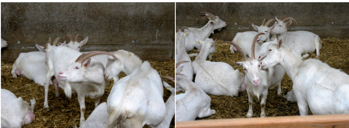
Abbildung 4: Freundschaftliches Beknabbern wird sichtlich genossen.