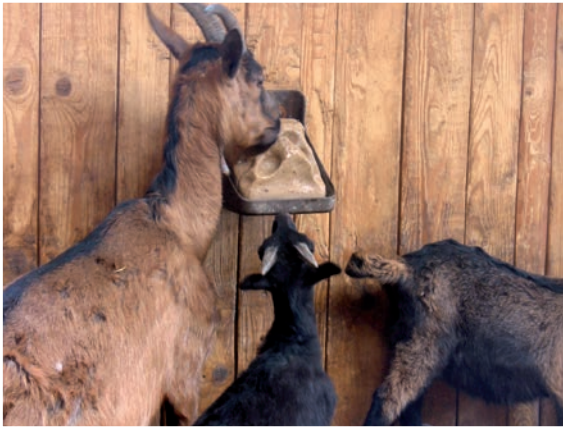
Abbildung 41: Futter schlechter Qualität, unausgewogene Nährstoff-, Mineralstoff- oder Spurenelementversorgung kann die Aggressivität der Tiere erhöhen.