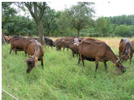
Abbildung 23: Eingliederung auf der Weide reduziert Stress und Verletzungsgefahr durch viel Platz zum Ausweichen und gutes Futterangebot.