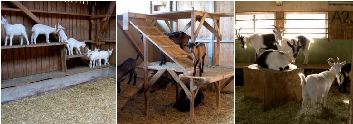
Abbildung 30: Verschiedene Klettermöglichkeiten oder erhöhte Bereiche