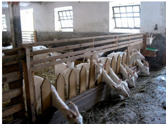
Abbildung 39: Gibt es weniger als 10 Prozent Futterreste ist die Fütterung rationiert.

Sind die Ziegen satt, sind sie auch ruhiger. Um die Konkurrenzsituation am Fressplatz zu minimieren ist es sinnvoll, mindestens dreimal am Tag frisches Futter vorzulegen. Ist das Grundfutter nicht von bester Qualität sollte noch häufiger frisches Futter vorgelegt werden. Dadurch haben auch rangniedere Tiere die Möglichkeit, qualitativ hochwertigeres Futter in ausreichender Menge aufzunehmen.