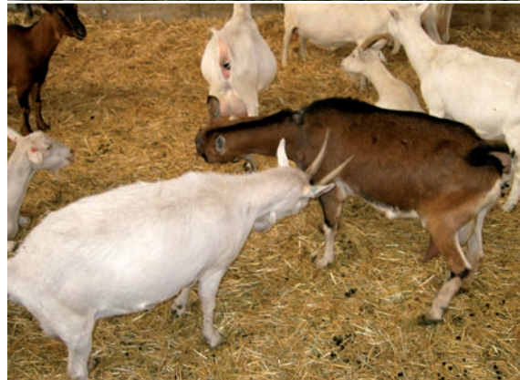
Abbildung 5: Drohen (oben), Drohen und Zurückdrohen (unten)