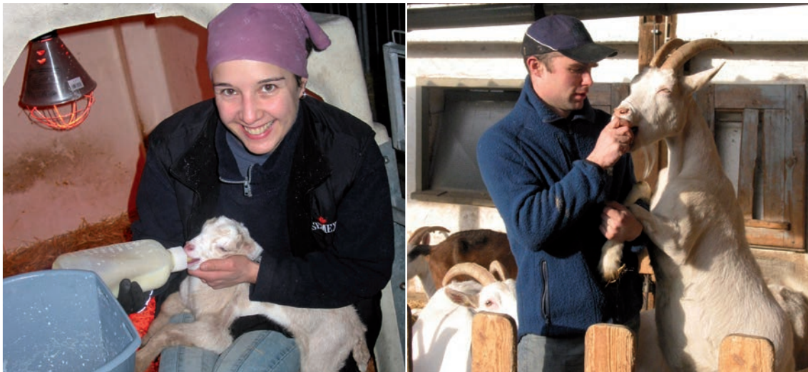
Abbildung 55: Früher positiver Umgang (links) und Belohnungen (rechts) erleichtern die Handhabung

Positiver Kontakt von Anfang an: Die weit in der Praxis verbreitete Methode der mutterlosen Kitzaufzucht kann als Grundstein für ein gutes Mensch-Tier-Verhältnis genutzt werden, indem regelmäßiger positiver Kontakt gepflegt wird. Die Tiere sind dann in Anwesenheit des Menschen ruhig. Doch auch bei muttergebundener Aufzucht ist eine gute Mensch-Tier-Beziehung möglich – die Kitze lernen von den Müttern.