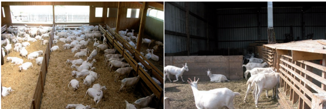
Abbildung 12 (links): Trennwände im Liegebereich unterteilen diesen. Relativ enge Durchgänge können jedoch zu Problemen führen. Mit mehreren Durchgängen können sich die Tiere besser verteilen.