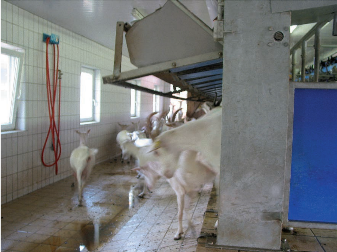
Abbildung 53: Frontantrieb ermöglicht schnelles Verlassen des Melkstandes