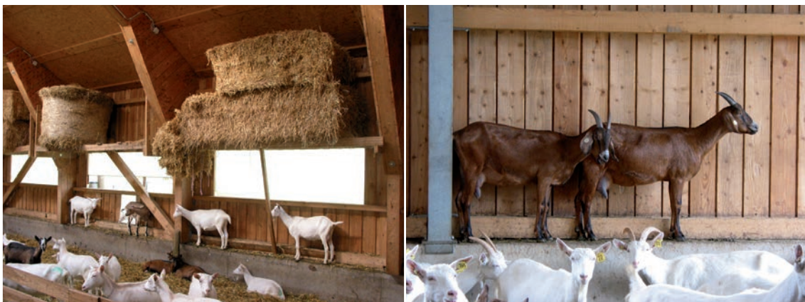
Abbildung 29: Jede Erhöhung – z.B. Betonsockel – wird von den Ziegen genutzt.