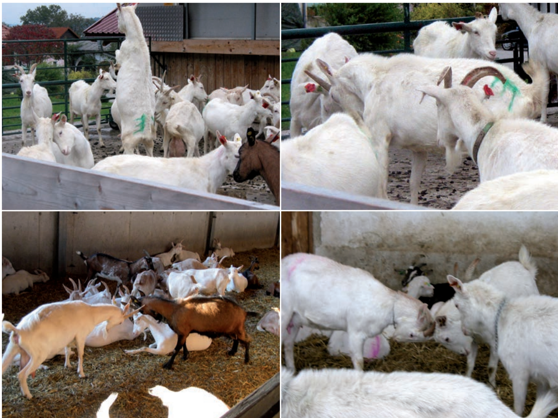
Abbildung 7: Drohen, Schieben mit den Köpfen / Hörnern und Zusammenstoßen der Köpfe mit den Hörnern bzw. der Stirn, teilweise mit vorherigem Aufsteigen auf die Hinterbeine vor dem Zusammenprall, gehören zu Rankämpfen.

Wenn neue Tiere in die Herde kommen, oder ganze Herden miteinander gemischt werden, müssen die Dominanzbeziehungen geklärt werden. Nicht alle Tiere müssen hierfür Rankämpfe austragen, aber die Häufigkeit der aggressiven Auseinandersetzungen steigt deutlich an. Auch in stabilen Herden kann es zu Auseinandersetzungen kommen, da heranwachsende Tiere einen neuen Platz in der Rangordnung einnehmen wollen. Allerdings sind hier die Dominanzbeziehungen oft über Jahre stabil.