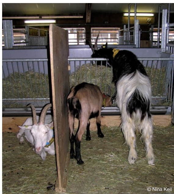
Abbildung 46: Unterteilung des Fressbereichs durch eine Trennwand.