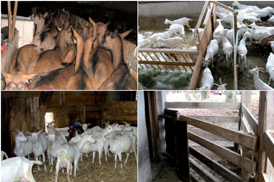
Abbildung 15: Enge Durchgänge oder Engstellen auf Treibwegen, im Stall oder zum Auslauf bergen ein Risiko für Verletzungen und Stress (siehe auch Abbildung 6)

Keine Engstellen im Stall: Zu geringe Gangbreiten oder andere Engstellen im Stall verringern die Ausweichmöglichkeiten von rangniederen Tieren und erhöhen damit den Stress in der Herde und die Gefahr von Verletzungen. Dies gilt auch insbesondere bei der Eingliederung von neuen Tieren oder beim Umgruppieren der Herde. Engstellen im Stall können auch durch Abtrennungen eines Stallbereiches entstehen. Bestehende Sackgassen sollten z.B. durch Anordnung eines Auslaufes entschärft werden. Es ist immer auf die Möglichkeit des Rundlaufes im Stall zu achten. Spitze Winkel bei Abtrennungen sind Sackgassen vergleichbar und müssen unbedingt vermieden werden.