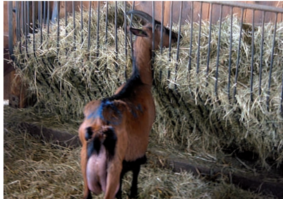
Abbildung 56: In der verbogenen Futterraufe besteht die Gefahr des Hängenbleibens und dann der Verletzung durch andere Tiere, wenn die Ziege der Aufforderung, den Platz zu verlassen, nicht (schnell genug) nachkommen kann.

Sofortiges Reparieren von defekten Fressgittern und anderen, verletzungs-trächtigen Stalleinrichtungen: In defekten oder nicht einwandfrei funktionierenden Fressgittern kann es zu Verletzungen der Tiere kommen; entweder durch die Fressgitter selbst oder durch andere Tiere der Herde, wenn diese das Tier verdrängen wollen und es im Fressgitter festhängt.