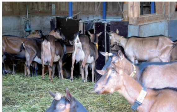
Abbildung 47: Ohne Schutztür besteht am Kraftfutterautomaten erhöhte Verletzungsgefahr

Schutztür in Kraftfutterautomaten: Kraftfutterautomaten sind zwar ernährungsphysiologisch günstig durch die Aufteilung der Kraftfutterrationen, können jedoch zu einer erheblichen Unruhe in der Herde führen. Tiere im Kraftfutterautomaten können von hinten von anderen Tieren gestoßen werden. Um dies zu verhindern, sollte ein Kraftfutterautomat mit automatisch verschließender Schutztür montiert werden.