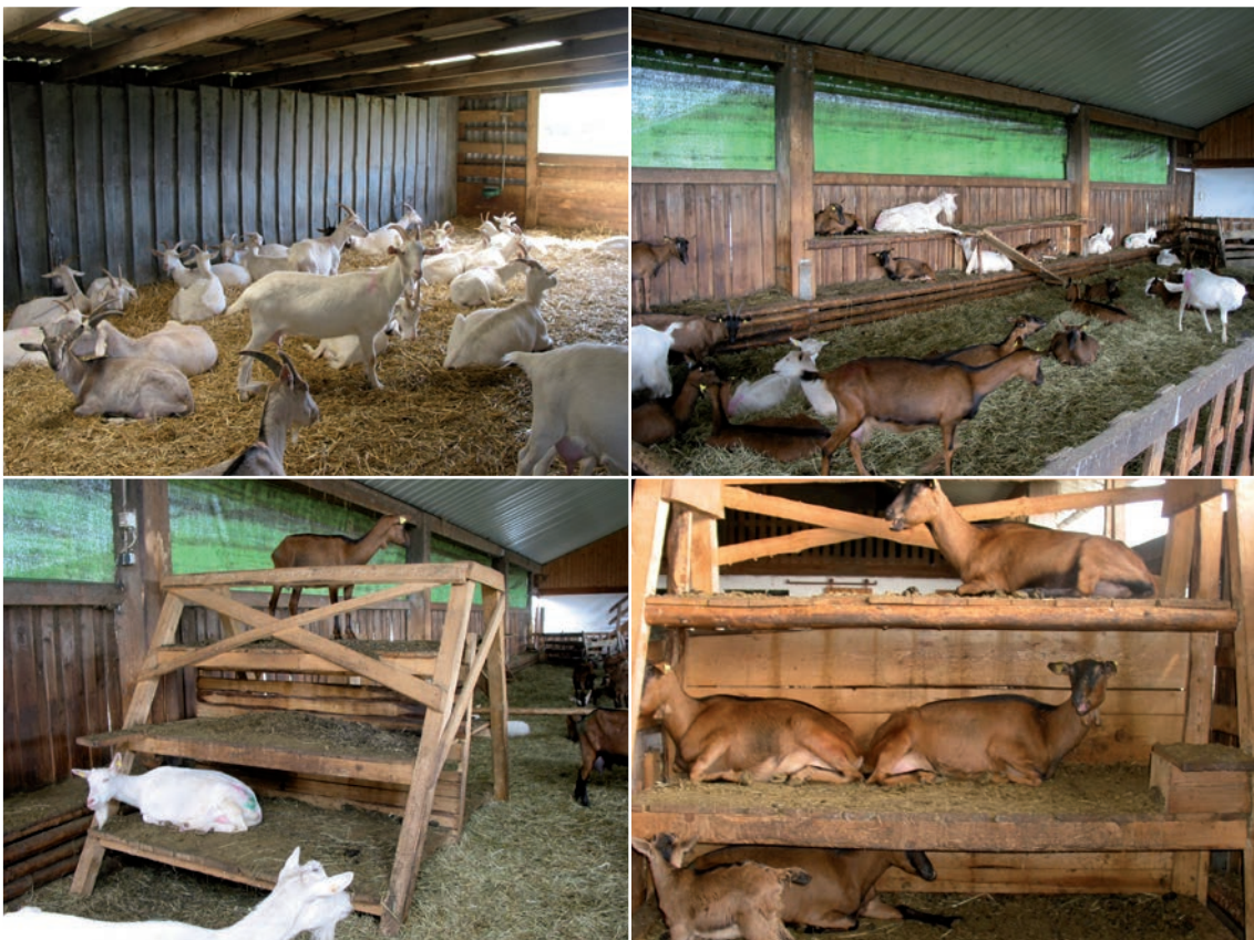
Abbildung 32: Viel Platz zum Liegen ermöglicht allen Tieren ungestörtes Ruhen – optimal ist es noch mit erhöhten Ebenen kombiniert.