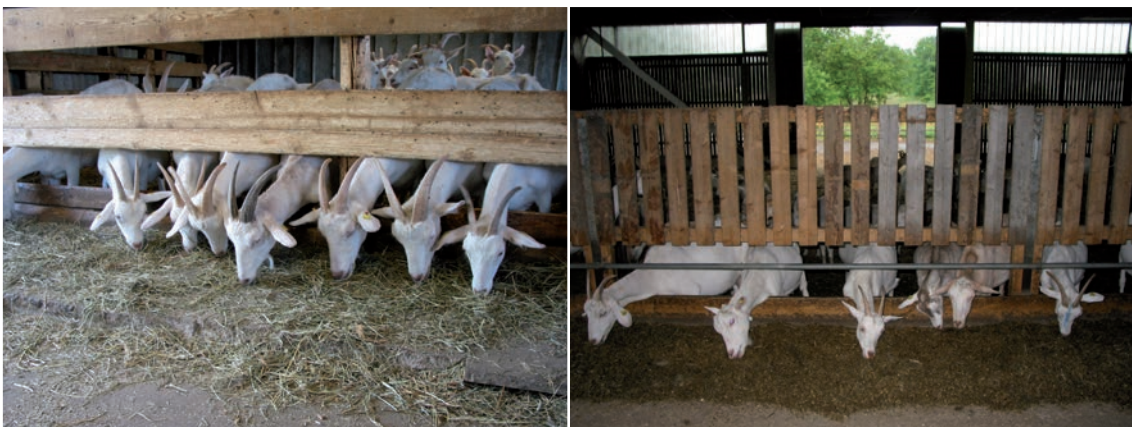
Abbildung 37: Nackenbrett bzw. Nackenrohr

Nackenrohr/-brett als Fressgitter möglichst vermeiden: Sie sind für Ziegen weniger gut geeignet. Sie bieten keine festen Fressplätze und insbesondere Tiere mit Hörnern haben hier Probleme, das Fressgitter schnell zu verlassen (siehe Abbildung 37). Falls Nackenrohr/-brettfressgitter verwendet werden, ist darauf zu achten, dass ständig Futter zur freien Aufnahme und in gleichbleibender Qualität vorliegt. In der Jungtieraufzucht können sie bei ausreichendem Fressplatzangebot eingesetzt werden, da die Rangbeziehungen bei Jungtieren noch nicht so ausgeprägt zum Tragen kommen und die Leistungsanforderungen an die Tiere geringer ist.