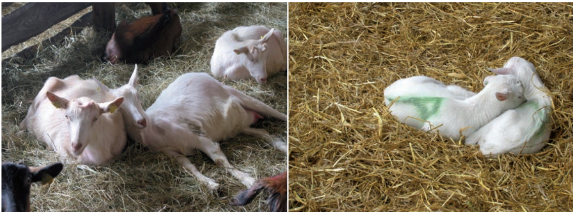
Abbildung 3: Kontaktliegen bei befreundeten Ziegen bzw. Kitzen

Freundliche soziale Verhaltensweisen sind das Suchen bzw. Akzeptieren von Körperkon- takt mit Herdenmitgliedern beim Hinlegen. Dies geschieht bei befreundeten adulten Ziegen, bei Mutter und Kind und von Kitzen untereinander. Die soziale, also gegenseitige, Körper- pflege ist selten zu beobachten und kommt nur zwischen gut befreundeten Ziegen vor. Be- freundete Tiere halten sich häufig nah beieinander auf, und liegen gerne in Körperkontakt zueinander.