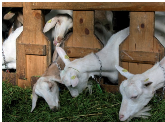
Abbildung 44: Schwedenfressgitter sind nur bedingt für behornete Ziegen geeignet: das horizontale Abschlussbrett muß weit über den Köpfen der Ziegen angebracht sein und die Fressplatzbreite und damit der Abstand zwischen den Brettern oben breit genug, damit sich die Ziegen nicht mit den Hörnern verhaken (für Maße siehe Keil und Pommereau 2013, ART-Baumerkblatt Nr. 02.01). Das Beispiel ist nicht für behornete Tiere geeignet.