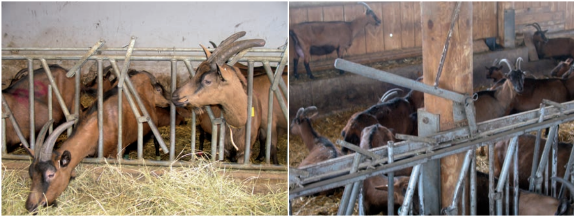
Abbildung 38: Bei Scherenfressgittern müssen behornete Tiere genau ausfädeln, um es zu verlassen.