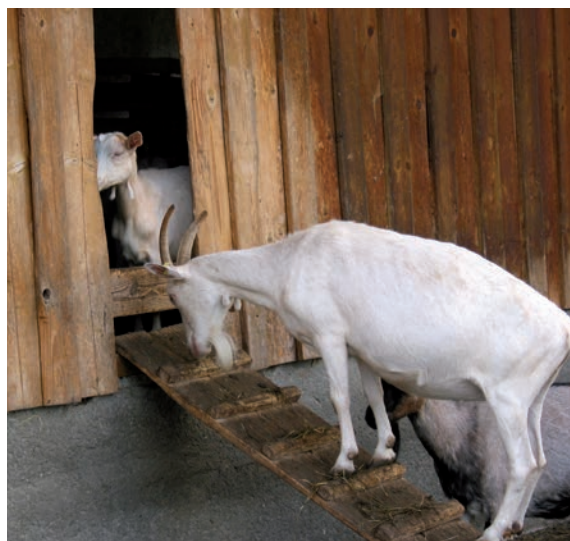
Abbildung 6: Ein schmaler Durchgang führt eher zu Konflikten – hier eine drohende Ziege am Durchgang vom Auslauf zum Stall.