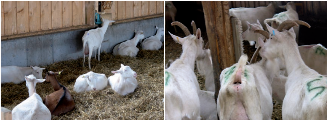
Abbildung 10: Viel Platz um die Tränke oder Bürsten ist günstig, die Tränke ist jedoch zu hoch angebracht (eine Antrittsstufe wäre hier günstig).

Gute Anordnung und klare Gliederung der Stallbereiche und der Einrichtung: Plätze mit erhöhter Konkurrenz (z.B. Fressplätze, Tränken, Bürsten) sollten gut im Stall verteilt und jederzeit frei zugänglich sein. Zum Beispiel dicht beieinander liegende Tränkeeinrichtungen erhöhen die Anzahl an Tieren in diesem Bereich und damit die Gefahr von unnötigen Auseinandersetzungen zwischen den Ziegen. Die Bereiche so anordnen, dass aktive Tiere ruhende nicht stören.