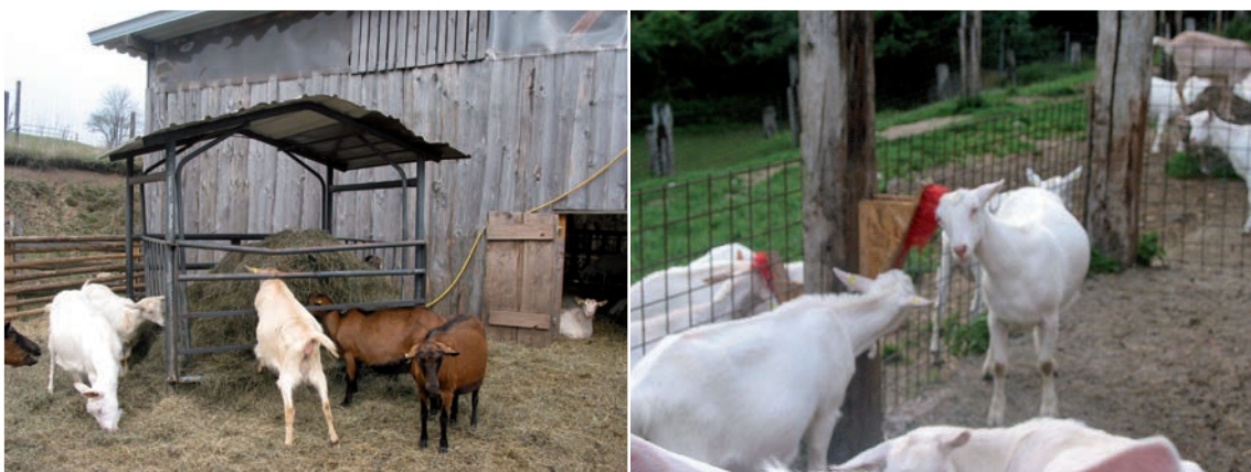
Abbildung 26: Raufen und Bürsten erhöhen die Attraktivität des Auslaufes und entlasten den Stall