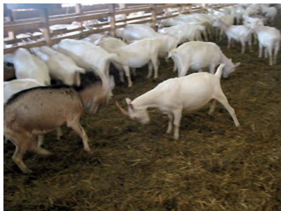
Abbildung 20: Drohen, Stoßen und Kämpfe (siehe auch Abbildung 7) gehören zum Sozialverhalten der Ziegen (siehe oben). Mit Ziegen, die immer wieder durch verletzungsträchtige Aggressionen auffallen, sollte jedoch nicht weitergezüchtet werden.