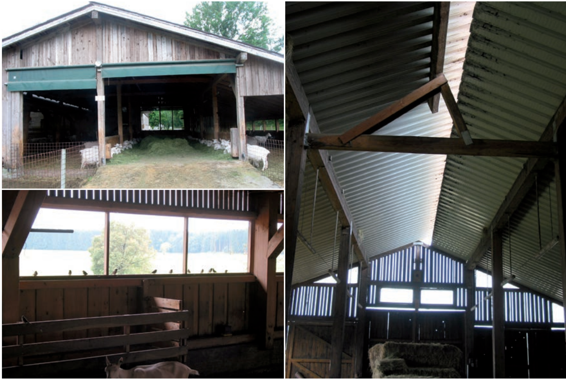
Abbildung 49b: Viel Licht und gute Belüftung sind wichtig.

Kratzbürsten: Kratzbürsten dienen der Körperpflege der Ziegen und sollten in ausreichender Anzahl vorhanden sein, um keine zusätzlichen Konkurrenzsituationen hervorzurufen.