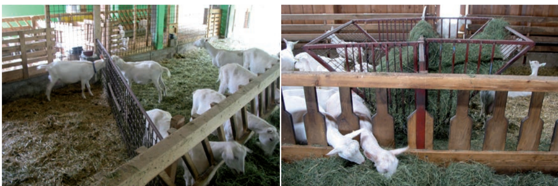
Abbildung 16: In spitzen Winkeln können Tiere schlechter Ausweichen und das Risiko für Verletzungen ist erhöht (siehe Abbildung 36 rechts).