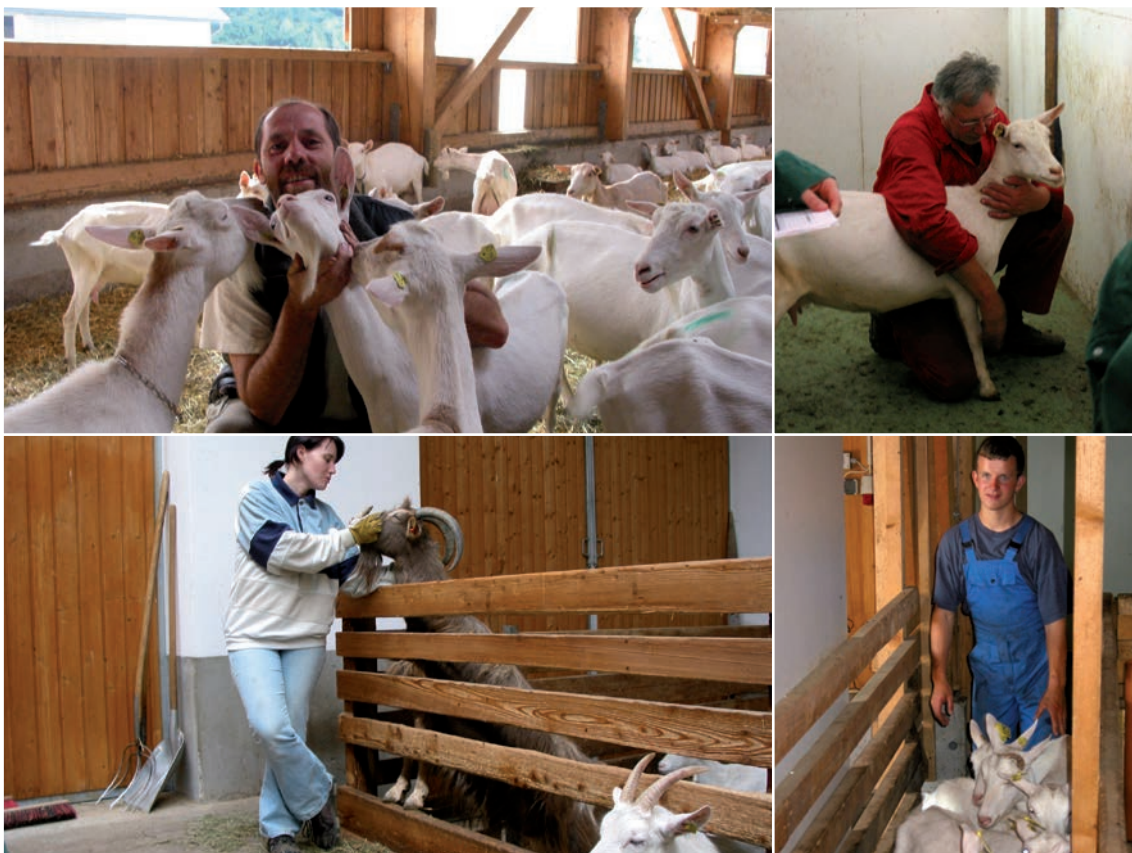
Abbildung 54: Freundlicher und geduldiger Umgang fördert eine gute Beziehung der Ziegen zum Menschen

Angepasster Umgang mit den Tieren: Ruhiger, positiver aber bestimmter Umgang reduziert die Furcht des Tieres vor dem Menschen und damit den Stress. Interaktionen mit den Ziegen, die nicht unbedingt notwendig sind und Stress für das Tier bedeuten, sollten unterlassen werden.