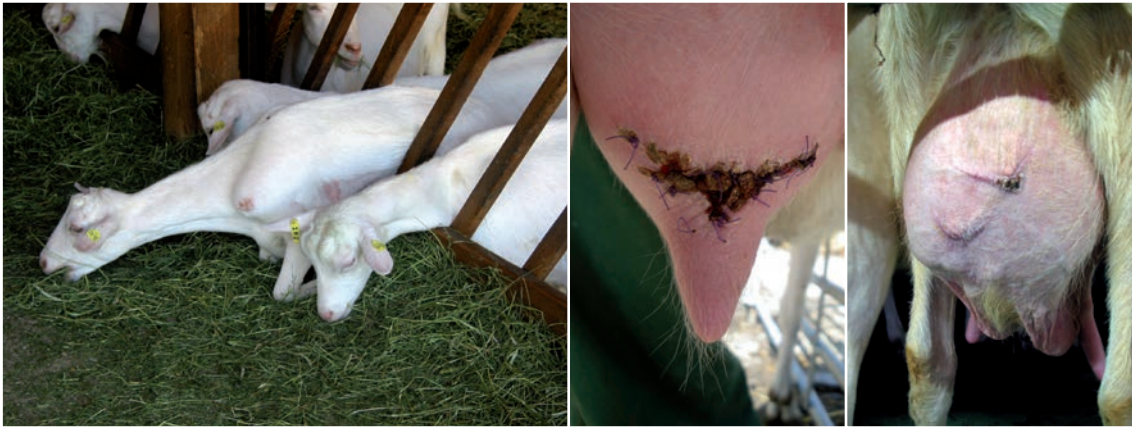
Abbildung 36: Bei größerem Abstand zwischen den Brettern können sich manche Ziegen hindurchzwängen (Foto links) und teilweise beim Zurückziehen steckenbleiben. Solche Situationen stellen ein hohes Risiko für Verletzungen dar – insbesondere in Herden mit behornten Tieren kann es dabei zu schweren Verletzungen, des Euters kommen (Foto Mitte: frische, genähte, tiefe Verletzung; Foto rechts: teilweise vernarbt)

Nackenrohr/-brett als Fressgitter möglichst vermeiden: Sie sind für Ziegen weniger gut geeignet. Sie bieten keine festen Fressplätze und insbesondere Tiere mit Hörnern haben hier Probleme, das Fressgitter schnell zu verlassen (siehe Abbildung 37). Falls Nackenrohr/-brettfressgitter verwendet werden, ist darauf zu achten, dass ständig Futter zur freien Aufnahme und in gleichbleibender Qualität vorliegt. In der Jungtieraufzucht können sie bei ausreichendem Fressplatzangebot eingesetzt werden, da die Rangbeziehungen bei Jungtieren noch nicht so ausgeprägt zum Tragen kommen und die Leistungsanforderungen an die Tiere geringer ist.