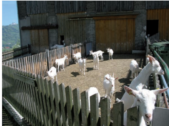
Abbildung 27: Ein sonniger Auslauf ist in den kalten Monaten beliebt.

Klettermöglichkeiten / erhöhte Aktivitätsbereiche: Ziegen bewegen sich viel, klettern und springen auf Gegenstände. Deswegen sollten ihnen Klettermöglichkeiten und erhöhte Bereiche angeboten werden. Ein solches Angebot wird stark genutzt und dient auch der Strukturierung des Stalles.