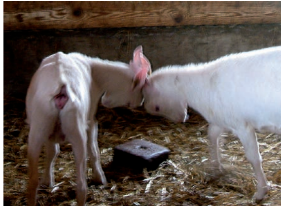
Abbildung 8: Kitze beim sozialen Spiel. Auch bei ausgewachsenen Ziegen kommt spielerisches Kämpfen vor.

Der Rang eines Tieres kann sich auf den Stress und die Leistung auswirken. Ungünstige Bedingungen im Stall und Management, z.B. zu wenig Fressplätze und zu wenig Futter, wirken sich vor allem auf rangniedere Tiere aus, die dann ihre Bedürfnisse nach Futter, Ruhe etc. nicht oder nur eingeschränkt decken können. Dies trifft sowohl für hornlose, behornte als auch gemischte Bestände zu. Bei rangniederen Tieren kann es so durch sozialen Stress zu deutlichen Verlusten in der Milchleistung kommen (manche Quellen sprechen von 10 bis 50 Prozent).