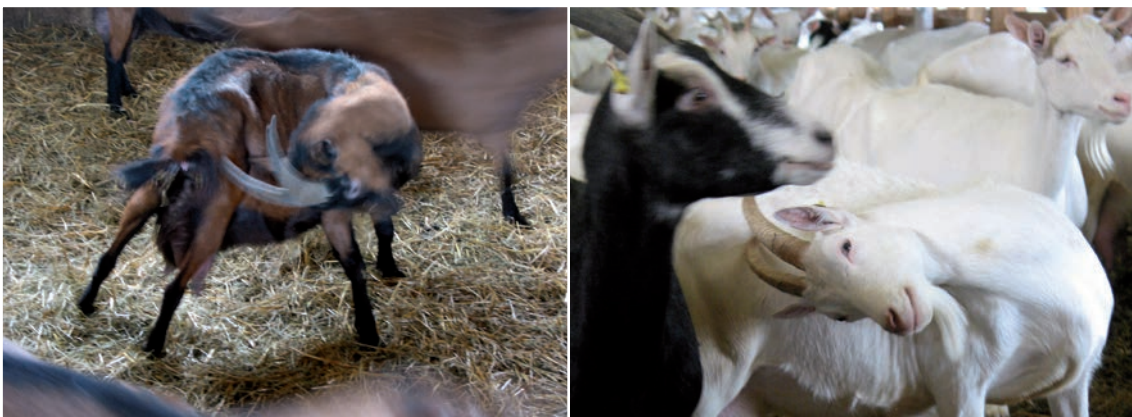
Abbildung 9: Auch für die Körperpflege werden Hörner ausgiebig genutzt

Ziegen nutzen die Hörner im Sozialverhalten vor allem zum Drohen und Imponieren, aber auch zum Kampf und zum Stoßen um andere zu verdrängen. Daneben verwenden Ziegen die Hörner auch zur Körperpflege, d.h. sie kratzen sich damit zum Beispiel am Rücken. Auch wenn sich die Individualdistanzen zwischen behornten und hornlosen Ziegen im Experiment nicht unterscheiden, wird die Individualdistanz bei den behornten Ziegen gewöhnlich mehr respektiert. Dadurch kommt es bei hornlosen Ziegen zu einer etwas höheren Fressplatzbelegung, d.h. mehr Tiere fressen gleichzeitig am Fressgitter, jedoch auch zu mehr ranganzeigenden Verhaltensweisen (z.B. Drohen, Stoßen, Beißen), vor allem mit Körperkontakt. Bezüglich des Ranges sind behornte Ziegen gleichaltrigen hornlosen Herdengenossen normalerweise überlegen.