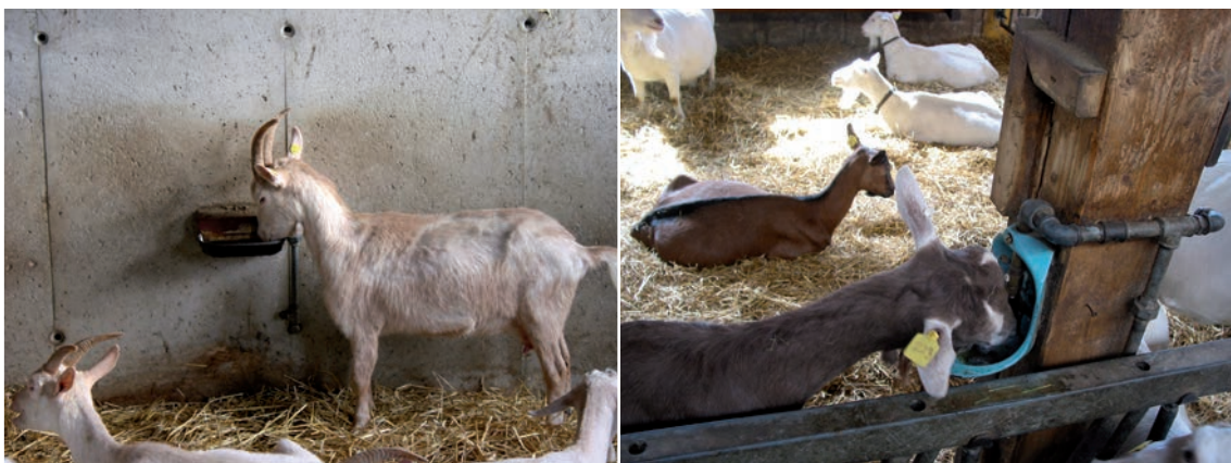
Abbildung 48: Eine ausreichende Anzahl an Tränken vermindert Auseinandersetzungen.

Tränken in ausreichender Anzahl und frei zugänglich: Abhängig von der Anzahl der Tiere die an einer Tränke gleichzeitig Wasser aufnehmen können, ist eine ausreichende Anzahl an Tränken vorzusehen. Dabei ist zu beachten, dass auch längere Trogränken von einem einzigen ranghohen Tier für längere Zeit blockiert werden können, mehrere getrennt angeordnete Tränken dagegen nicht. Bei einer Untersuchung auf Praxisbetrieben gab es weniger Euterverletzungen, wenn den Tieren mindestens eine Tränke pro 25 Ziegen zur Verfügung stand – unabhängig vom Tränketypp – dies ist daher empfehlenswert. In jeder Bucht sollten mindestens zwei Tränken vorhanden sein, da sonst ein Tier den gesamten Zugang zum Wasser blockieren kann. Zudem sollte nur frisches Wasser zur Verfügung gestellt werden. Angewärmtes Wasser im Winter wird von den Ziegen gern angenommen. Auch im Laufhof, Auslauf oder Weide sind Tränken aufzustellen.