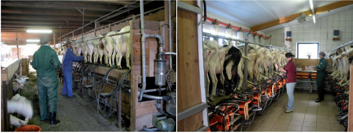
Abbildung 52: Beispiele für Melkstände