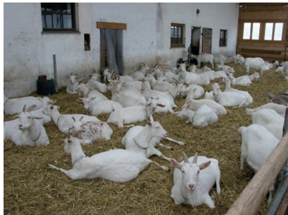
Abbildung 19: In etwas größeren Buchten können Tiere besser eine größere Distanz einhalten.