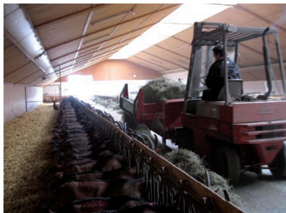
Abbildung 40: Häufige Futtervorlage ist günstig.