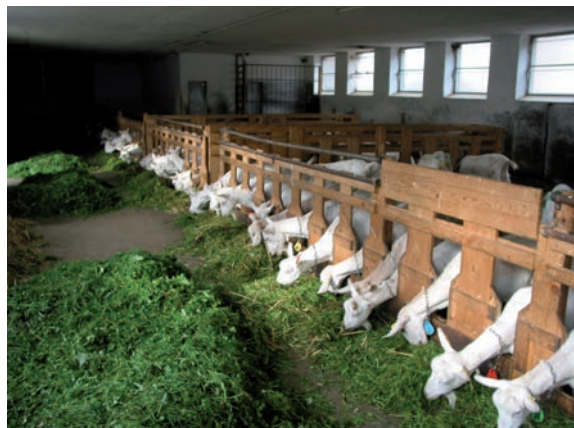
Abbildung 43: Genügend breite Fressplätze ermöglichen relativ ungestörtes Fressen auch bei hochbegehrtem Futter.

Ausreichend Platz am Fressplatz: Ist der Fressplatz zu eng bemessen, können rangniedere Tiere nicht ungestört Fressen. Die Fressplatzbreiten sollte daher mindestens 45 Zentimeter betragen. Dies gilt insbesondere bei behorneten Tieren. Im abgesperrten Fressgitter ohne eine ausreichende Sichtblende werden die rangniederen von den ranghöheren Tieren am Fressen gehindert und der Stress ist in dieser Situation für die rangniederen Tiere erheblich. Je kleiner die Herde ist, desto großzügiger muss die Fressplatzbreite sein. Die Fressplatzbreite kann zum einen durch Vergrößerung des Fressplatzes oder durch Unterbelegung der Fressplätze erreicht werden. Auch bei ad libitum Fütterung ist eine Unterbelegung empfehlenswert, um auch rangniederen Ziegen stressfreien Zugang zum höchstwertigen frisch vorgelegten Futter zu ermöglichen. Von Überbelegung ist in jedem Fall abzuraten. Auch bei ad libitum Fütterung muss unbedingt mindestens 1 Fressplatz pro Ziege angeboten werden.