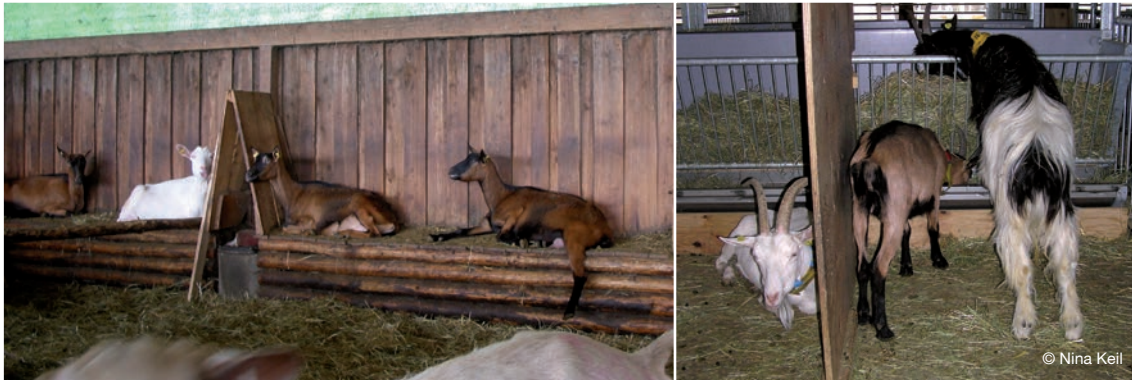
Abbildung 11: Erhöhte Liegefläche mit Trennwänden bzw. Trennwand am Fressgitter – so können auch zwei Tiere nahe nebeneinander liegen bzw. fressen, die sonst viel Abstand zueinander einhalten würden.