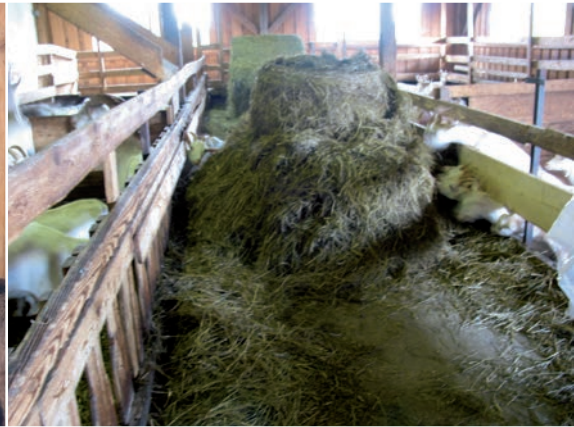
Abbildung 42: Gibt es nur an wenigen Fressplätzen besseres, frischeres oder überhaupt Futter (hier ist der Siloballen von einigen wenigen Fressplätzen aus erreichbar), führt dies zu hoher Konkurrenz und damit Aggression und Verletzungsgefahr.

Ausreichend Platz am Fressplatz: Ist der Fressplatz zu eng bemessen, können rangniedere Tiere nicht ungestört Fressen. Die Fressplatzbreiten sollte daher mindestens 45 Zentimeter betragen. Dies gilt insbesondere bei behorneten Tieren. Im abgesperrten Fressgitter ohne eine ausreichende Sichtblende werden die rangniederen von den ranghöheren Tieren am Fressen gehindert und der Stress ist in dieser Situation für die rangniederen Tiere erheblich. Je kleiner die Herde ist, desto großzügiger muss die Fressplatzbreite sein. Die Fressplatzbreite kann zum einen durch Vergrößerung des Fressplatzes oder durch Unterbelegung der Fressplätze erreicht werden. Auch bei ad libitum Fütterung ist eine Unterbelegung empfehlenswert, um auch rangniederen Ziegen stressfreien Zugang zum höchstwertigen frisch vorgelegten Futter zu ermöglichen. Von Überbelegung ist in jedem Fall abzuraten. Auch bei ad libitum Fütterung muss unbedingt mindestens 1 Fressplatz pro Ziege angeboten werden.