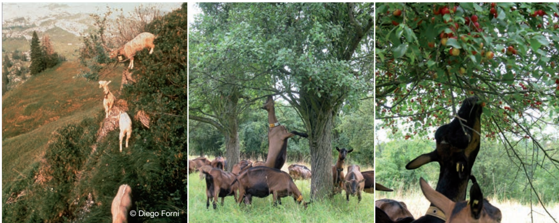
Abbildung 33: Ziegen fressen gerne von Büschen und Bäumen.

Ziegen reagieren sehr empfindlich auf die Qualität des Wassers und lehnen verunreinigtes Wasser ab. Im Allgemeinen bevorzugen Ziegen temperiertes Wasser. Ziegen sind Saugtrinker und trinken von einer freien Wasseroberfläche. Je nach Futterart, Milchleistung und Temperaturen trinken die Tiere bis zu 20 Liter Wasser pro Tag. In gemäßigttem Klima geht man von einem Wasserverbrauch bei laktierenden Ziegen von 3,5 Liter pro Kilo Trockensubstanz Futteraufnahme aus.