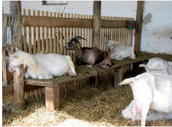
Abbildung 31: In Kleingruppen ist eine Strukturierung der Liegefläche durch erhöhte Ebenen besonders wichtig.

auszuleben und bieten mehr Ausweichmöglichkeiten. Auseinandersetzungen können so vermindert werden. Es ist günstig, die Liegebretter noch mit Trennwänden weiter zu strukturieren (siehe Abbildung 11). Reinigung und Pflege der Liegebretter bedeuten einen erhöhten Arbeitsaufwand, der jedoch durch die richtige Höhe (Tiere können in den Nischen nicht stehen, dadurch fällt kaum Kot an. Höhe der Bretter je nach Größe der Ziegen knapp unter Widerristhöhe) und eine geringe Neigung minimal gehalten werden kann.