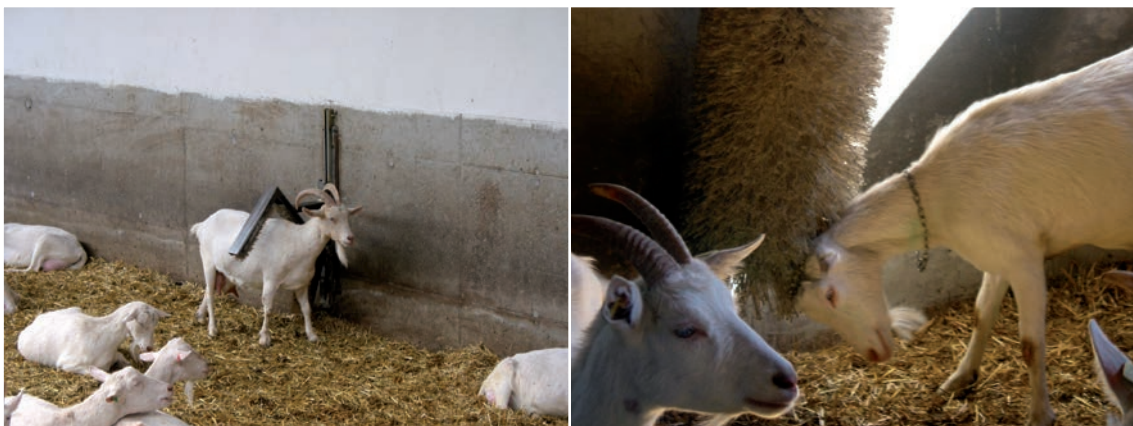
Abbildung 50: Bürsten werden gerne angenommen und fördern das Wohlbefinden.

Auch Scheuerpfähle dienen dem Komfortverhalten durch Kratzen und Scheuern. Es ist darauf zu achten, dass keine Hölzer verwendet werden, die zum Splintern neigen, da dies ein Infektionsrisiko für die Tiere birgt