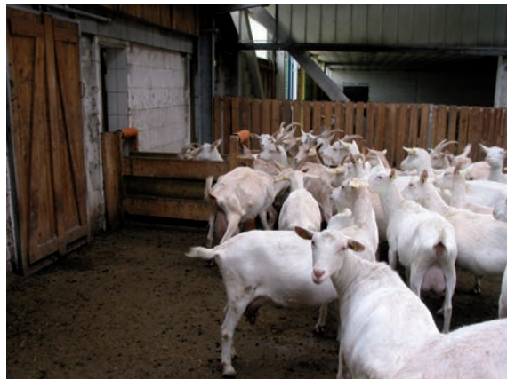
Abbildung 51: Ausreichend Platz im Wartebereich hilft Verletzungen zu vermeiden

Großräumiger Wartebereich: Beengte Platzverhältnisse im Wartebereich insgesamt oder in Teilbereichen (Engstellen, enge Treibgänge) fördern die sozialen Auseinandersetzungen zwischen den Tieren, erschweren ein Ausweichen und erhöhen die Verletzungsgefahr der Tiere. Bei einem Vergleich verschiedenen Flächenangebots im Wartebereich trat bei 0,7 m 2 pro Ziege über mehrere Wochen nur eine Verletzung auf, bei einem Platzangebot von nur 0,4 m 2 / Ziege dagegen sieben Verletzungen (bei insgesamt 66 Ziegen).