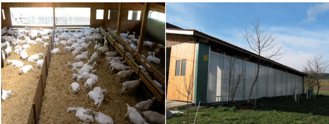
Abbildung 49a: Viel Licht und gute Belüftung sind wichtig.

Auslauf / Weide: ermöglicht Klimareize und Sonnenbaden, der Zugang zu schattigen Plätzen bei Hitze ist wichtig, ebenso eine Überdachung (Zugang zum Stall) bei Regen.