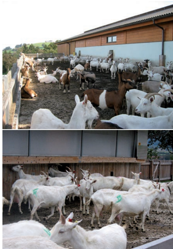
Abbildung 25: Ein Auslauf bietet zusätzlichen Platz zum Liegen, für Bewegung und Rückzug.

Auslauf / Laufhof: Ein Auslauf oder Laufhof hat neben den klimatischen auch große Vorteile für das Sozialverhalten einer Herde. Durch einen Auslauf erhält der Stall eine zusätzliche Strukturierung, die dazu beiträgt, dass rangniedere Tiere in Konfliktsituationen diesen aufsuchen und so Auseinandersetzungen mit ranghöheren Tieren aus dem Wege gehen können. Dies entschärft Konfliktsituationen im Stall und wirkt sich positiv auf das soziale Klima einer Herde aus. Zudem wird die Bewegungsfläche pro Tier erhöht und Sackgasen können durch einen Auslauf aufgelöst werden. Der Auslauf sollte ständig zugänglich sein, nach Möglichkeit mehrere, ausreichend breite Zugänge haben und Klettermöglichkeiten bieten. Tränken können die Attraktivität des Laufhofes deut-