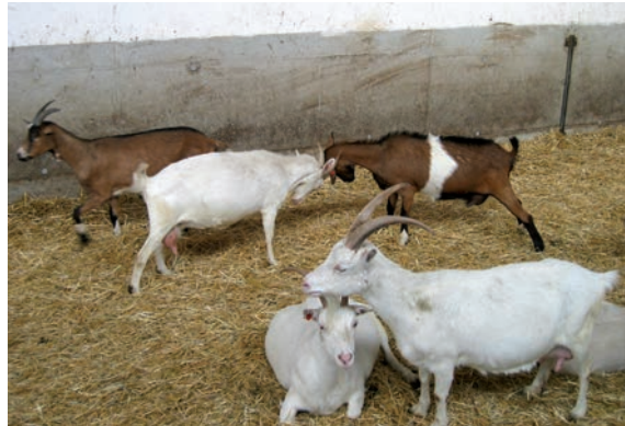
Abbildung 21: Bei einer Neugruppierung müssen die Rangplätze neu ausgemacht werden.

Eigene Nachzucht, kein Zukauf: Gemeinsames Aufwachsen fördert eine langfristig stabile Gruppenzusammensetzung und es können sich freundschaftliche Bindungen zwischen den Tieren bilden. Gemeinsam aufgewachsene Tiere tolerieren sich gegenseitig besser und weisen geringere Individualdistanz auf. Fremde, zugekaufte Tiere sollten so selten wie möglich in die Herde eingegliedert werden. Ein Aufwachsen der Nachzucht in der Herde, d.h. nur eine kurze Trennung der weiblichen Nachzucht von der Herde wäre hier ideal. Bei