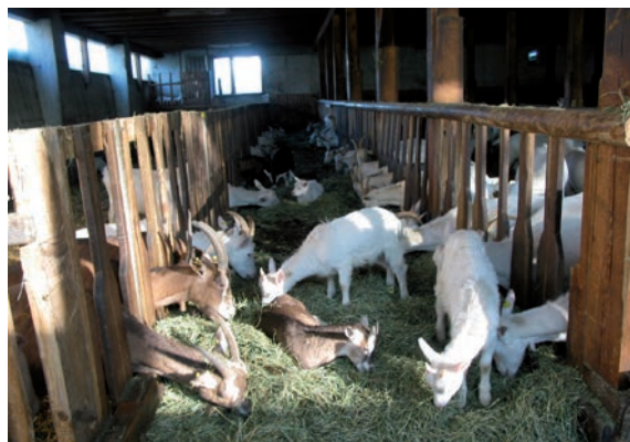
Abbildung 22: Mitlaufende Kitze verringern Aggressionen und Stress bei der Eingliederung. Jungtiere können jedoch meist durch die Fressgitter aus der Bucht springen.