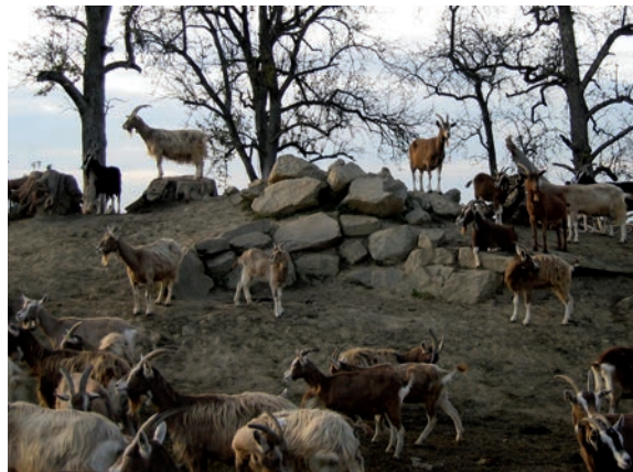
Abbildung 28: Felsige Klettermöglichkeiten im Auslauf sind ideal für die Ziegen