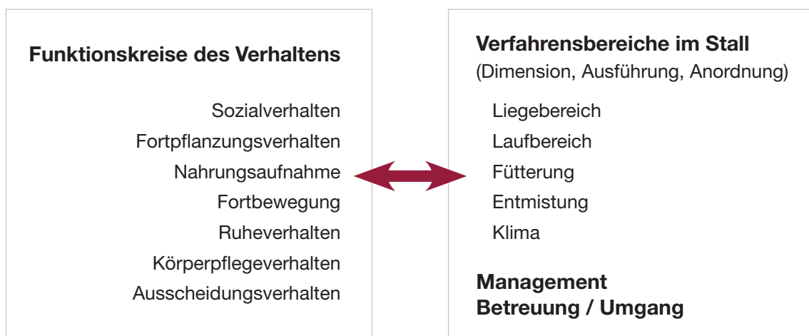
Abbildung 1: Die verschiedenen Bereiche im Stall, Management und Betreuung müssen so gestaltet sein, dass sie den Ziegen arteiniges Verhalten ermöglichen.

Eine optimierte Haltung bedeutet, die Verfahrensbereiche im Stall (Liegebereich, Laufbereich, Fressbereich, Entmistung, Lüftung) in Abmessungen, Anzahl und Anordnung, sowie das Management dem Verhalten der Tiere in den verschiedenen Funktionskreisen (Sozialverhalten, Futteraufnahmeverhalten, Ruheverhalten etc.) entsprechend anzupassen (Abbildung 1 und Abbildung 2).